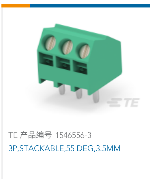
TE 产品编号 1546556-3 3P,STACKABLE,55 DEG,3.5MM