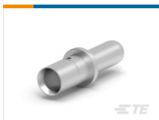
TE 产品编号SRK-PC-080-25-601 PIN, SOLID, SIZE M8, 25mm2, AG