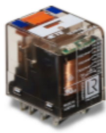
TE 产品编号 5-1415026-1 PT580L24