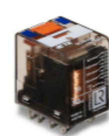
TE 产品编号 1-1393154-2 PT570024