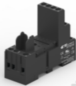
TE 产品编号 1-1415526-1 PT78742