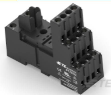
TE 产品编号 1415526-1 PT78722