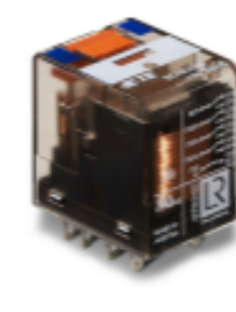
TE 产品编号 6-1419135-9 PT580220