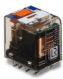
TE 产品编号 7-1415541-2 PT570MB0