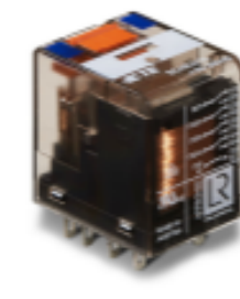
TE 产品编号 1-1393154-7 PT580024