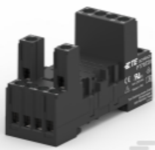
TE 产品编号 6-1415034-1 PT78720