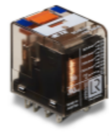
TE 产品编号 1-1393154-9 PT580060