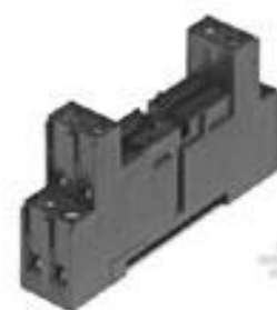
TE 产品编号 1860306-1 RT78725