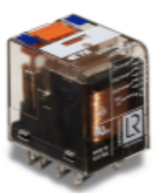
TE 产品编号 6-1419111-0 PT370012