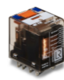
TE 产品编号 8-1419111-0 PT570012