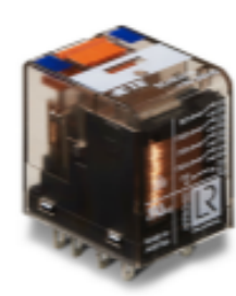
TE 产品编号 8-1419111-1 PT570048