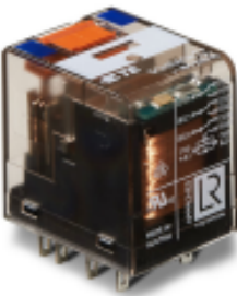
TE 产品编号 6-1415541-5 PT370LB2