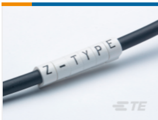
TE 产品编号EJ1953-000 06151413