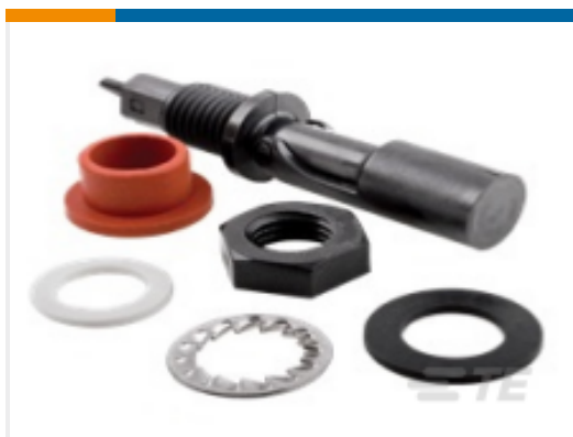
TE 产品编号80645-000 LS809-51 Liquid Level Sensor