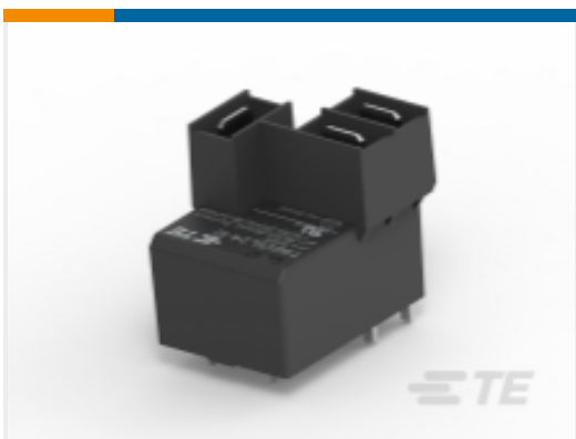
TE 产品编号1558676-6 T9GS1L24-22