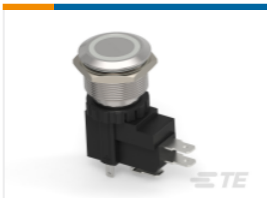
TE 产品编号 1-2364686-5 AVH22 FLT SS MT RNG GRN 24V16A