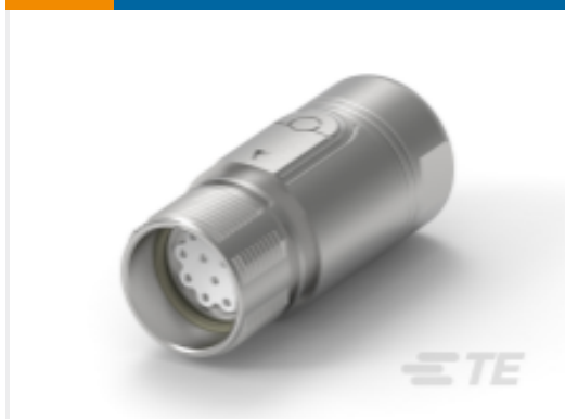
TE 产品编号 AKA012N00410100000 623 EXTENSION, SPEEDTEC