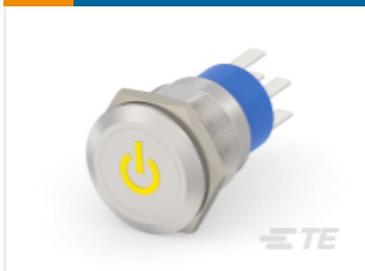
TE 产品编号 6-2213766-9 AV19 DPL 5A POWER LED YELLOW 12V