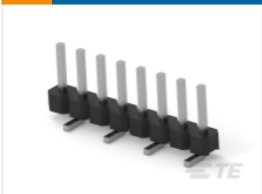
TE 产品编号 2842104-8 8P,2MM,BRK HDR,SRVT,SMD,0.76AU, TR W/CAP