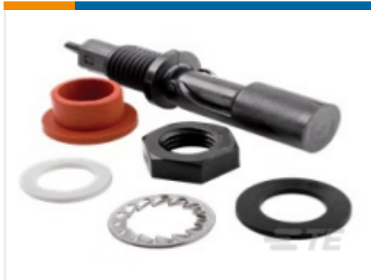
TE 产品编号 80645-000 LS809-51 Liquid Level Sensor