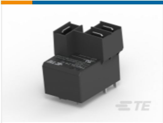
TE 产品编号 1558676-6 T9GS1L24-22