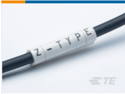
TE 产品编号 EC0366-000 Z-Type Push-On Markers