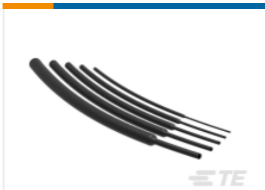
TE 产品编号EL88852001 VERSAFIT-1/8-0-STK