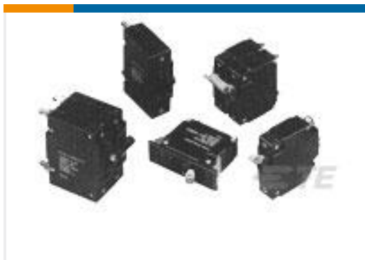
TE 产品编号1393255-8 W93-X112-30=M6/M7/M9/W6/W7