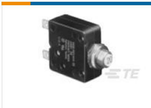
TE 产品编号2-1393249-0 W58-XB1A4A-6=W58