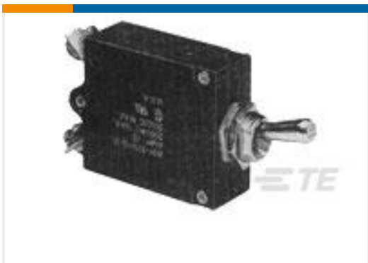
TE 产品编号3-1393247-6 W31-X2M1G-25=W23/W31