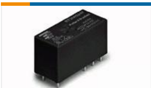
TE 产品编号2-1419108-6 RTB14024F