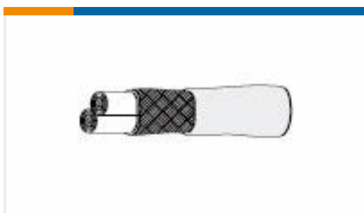
TE 产品编号868725-000 55A1112-24-9-9CS2275