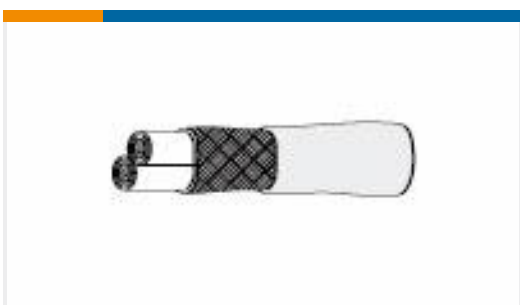
TE 产品编号123421-000 55A1122-20-9/96-9CS2275