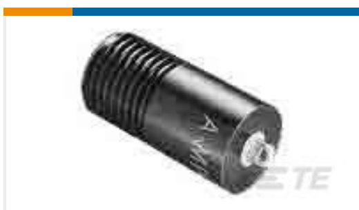
TE 产品编号834333-2 RECEPTACLE