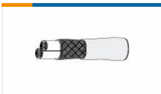
TE 产品编号299209-000 55A1122-16-9/96-9CS2275