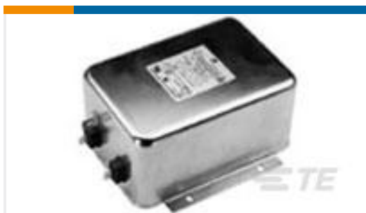
TE 产品编号1-6609046-2 20ET6 J0=F7813