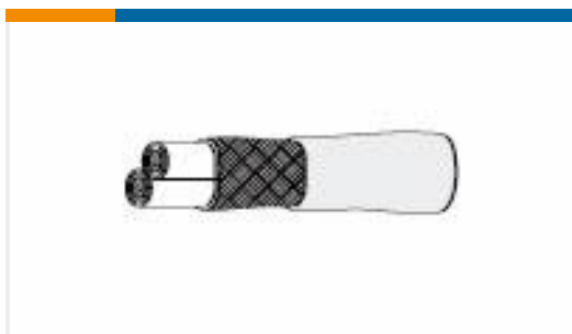
TE 产品编号597361-000 55A1112-20-9-9CS2275