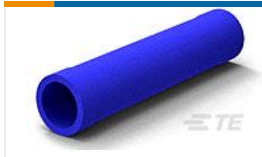
TE 产品编号2-34071-3 SPL,PG BUTT 16-14,FUNNEL ENTRY