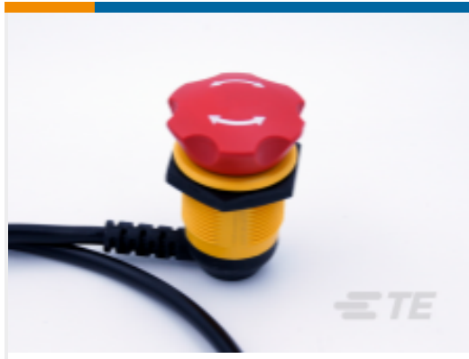
TE 产品编号K1158732 Emergency Switch ES-2011-T412-081A