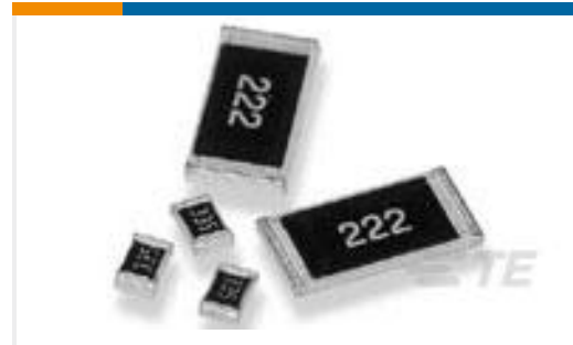
TE 产品编号1-1879496-3 CRGH0805 5% 39K 0.33W