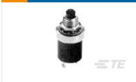
TE 产品编号1825516-2 MSP103C04