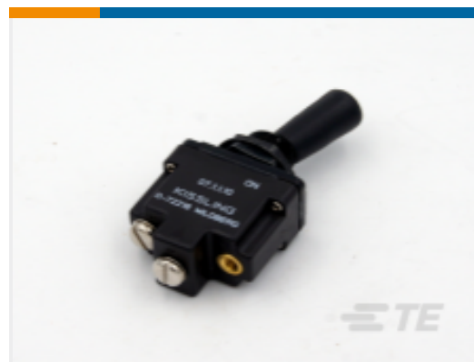
TE 产品编号K1007153 Toggle Switch 08-1-1-13