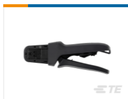
TE 产品编号DTT-20-03 CRIMP TOOL