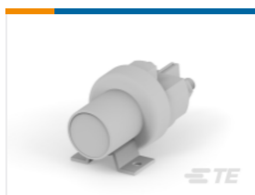
TE 产品编号K1008699 Relay 26-60-05