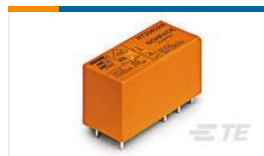
TE 产品编号1-1393239-3 RT114024