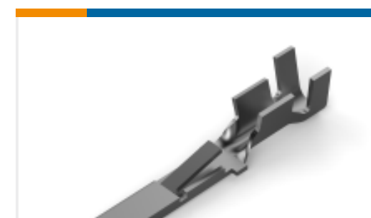
TE 产品编号928906-2 FF 110 TAB 20-15 AWG .016 TPPB