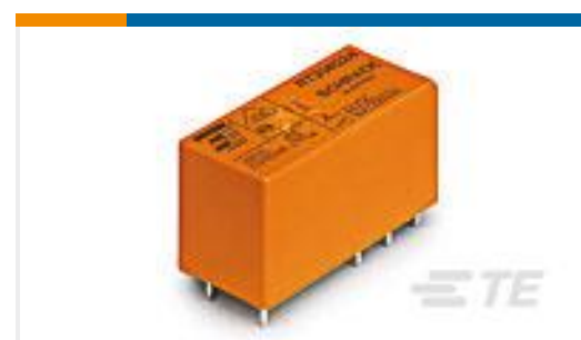
TE 产品编号1419108-1 RT114012