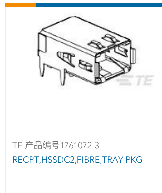
TE 产品编号1761072-3 RECPT,HSSDC2,FIBRE,TRAY PKG