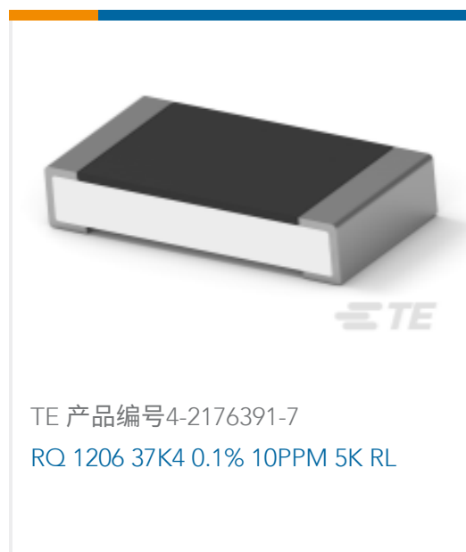
TE 产品编号4-2176391-7 RQ 1206 37K4 0.1% 10PPM 5K RL