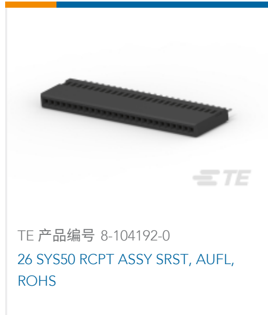
TE 产品编号 8-104192-0 26 SYS50 RCPT ASSY SRST, AUFL, ROHS