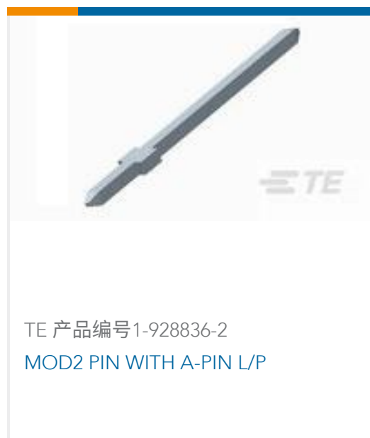
TE 产品编号1-928836-2 MOD2 PIN WITH A-PIN L/P