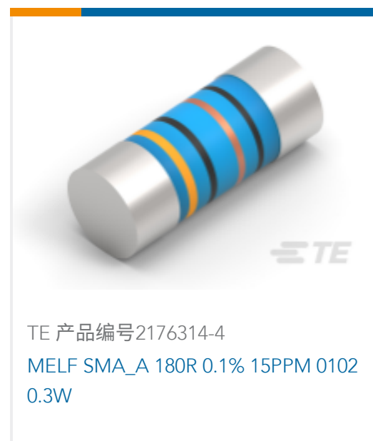
TE 产品编号2176314-4 MELF SMA_A 180R 0.1% 15PPM 0102 0.3W