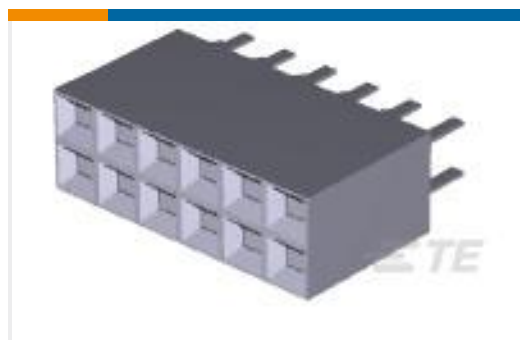
TE 产品编号5-534998-6 12 MODIV VRT DR CE 100/125