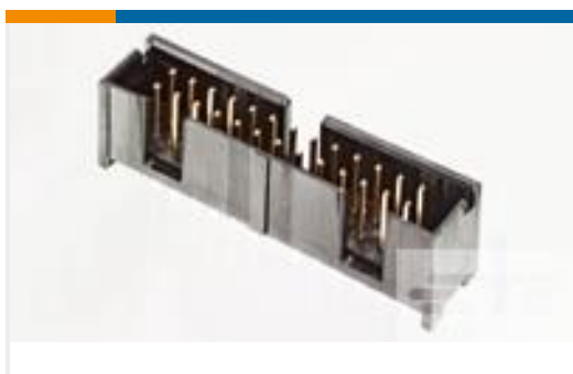
TE 产品编号5103308-5 A/L LOW PRO HDR 20P VERT BLACK