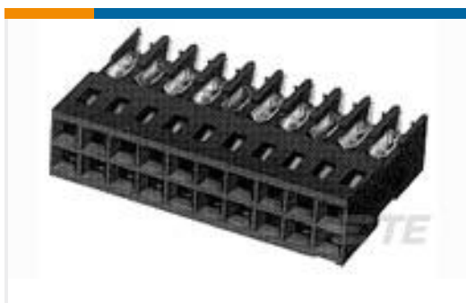
TE 产品编号5-102694-4 12 ampmodu mt assy dr sn