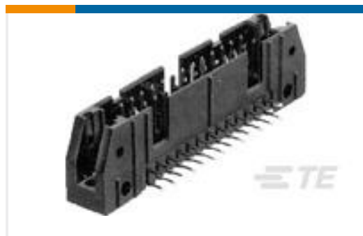
TE 产品编号5102159-6 A/L UNIV HDR 26P RA