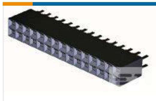
TE 产品编号6-534206-5 30 MODII VRT DR CE 100/115