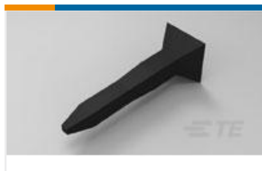
TE 产品编号499712-1 KEYING PLUG,NOVO RCPT