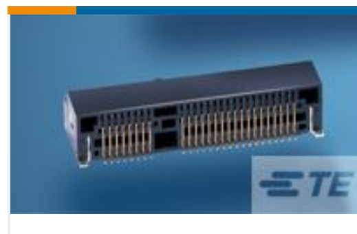
TE 产品编号2041262-1 Mini PCI-E 6.8H G/F