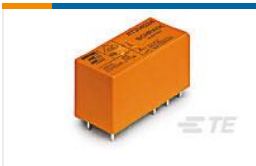
TE 产品编号1-1415898-6 RTS3T005