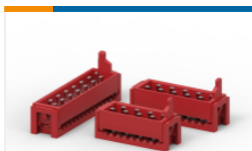
TE 产品编号 CAT-M5833-M2934A Male-on-Wire Connector, Micro-MaTch