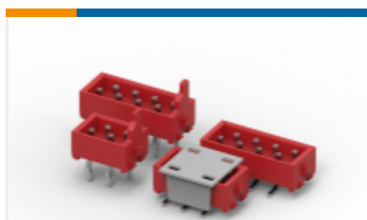
TE 产品编号 CAT-M5833-M2934 Male-on-Board Connector, Micro-MaTch