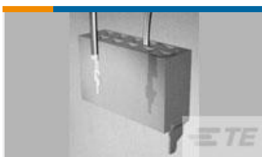
TE 产品编号 2-338095-0 MICRO-MATCH COSI HSG