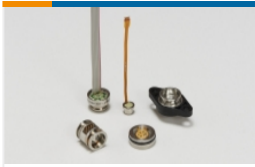
介质隔离压力传感器(27)