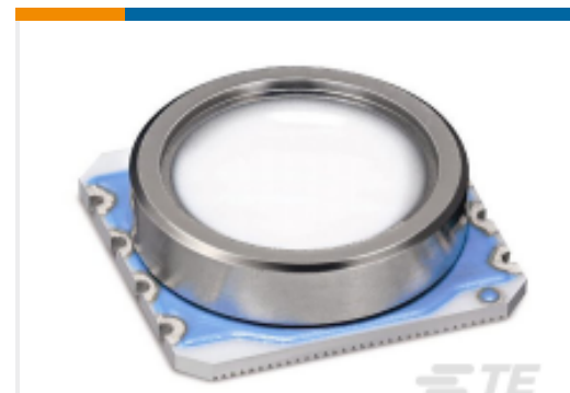
TE 产品编号325540009-00 MS5540-CM 1BAR WHITE GEL TUBE