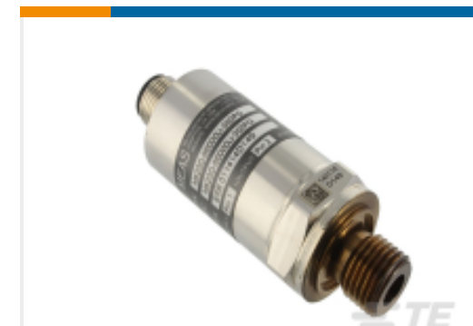
TE 产品编号M5254-000002-350BG PRESS XDCR M5254-000002-350BG