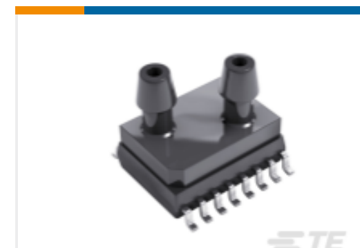
TE 产品编号9541-020C-D-C-3-S PRESSURE I2C 0.3PSID SO16