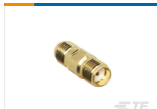
TE 产品编号ADP-SMAF-SMAF-G SMA Jack to SMA Jack