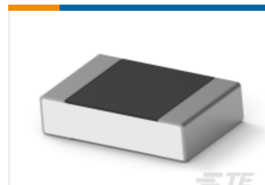
TE 产品编号7-2176378-6 RQ 0805 60R4 0.1% 10PPM 5K RL