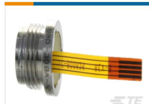
TE 产品编号89BSD-012BS-A PRESS,ISO,THRD CAPSULE,NO FTG