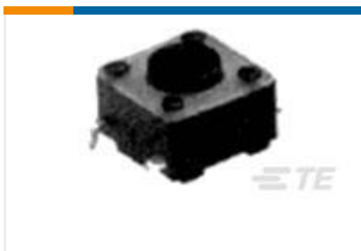
TE 产品编号4-1437565-1 FSM4JSMA=SMT,TACTILE,PB SWITCH