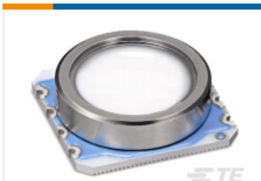
TE 产品编号MS580314BA01-00 MS5803-14BA01 DIGIT PRESSURE SENSOR TUBE