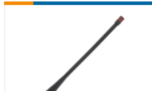
TE 产品编号ANT-433-CW-QW Antenna 1/4 Wave Whip 433MHz