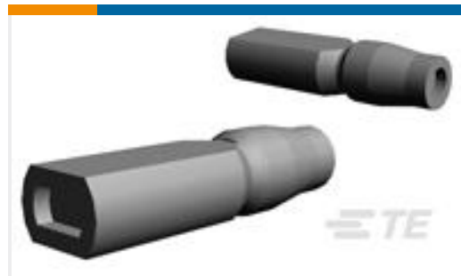
TE 产品编号1-170823-8 250 FASTON SLEEVE,REC., TRANSPARENT