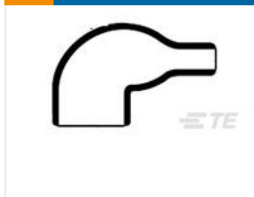
TE 产品编号814727-000 222A132-4/42-0