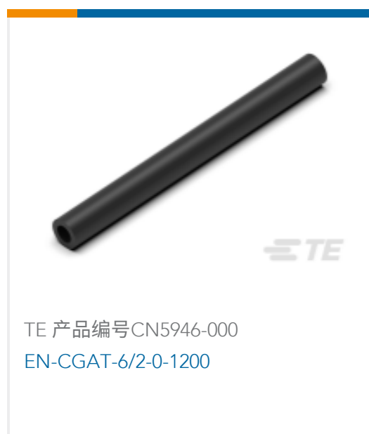
TE 产品编号CN5946-000 EN-CGAT-6/2-0-1200