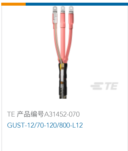
TE 产品编号A31452-070 GUST-12/70-120/800-L12