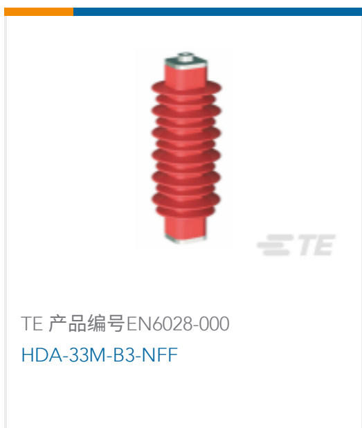
TE 产品编号EN6028-000 HDA-33M-B3-NFF