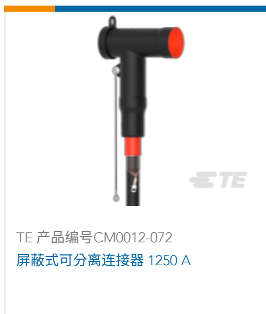
TE 产品编号CM0012-072 屏蔽式可分离连接器 1250 A