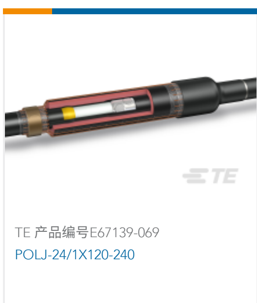
TE 产品编号E67139-069 POLJ-24/1X120-240