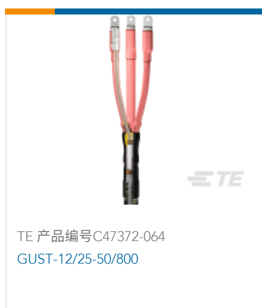
TE 产品编号C47372-064 GUST-12/25-50/800