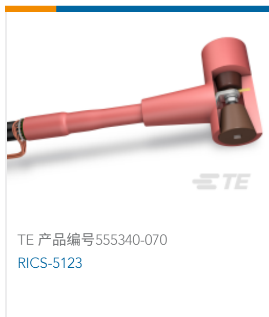
TE 产品编号555340-070 RICS-5123