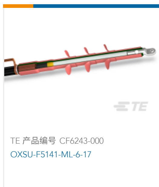
TE 产品编号 CF6243-000 OXSU-F5141-ML-6-17