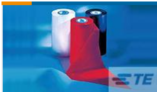
TE 产品编号311292-000 TMS-RJS-RIBBON-4DSCE