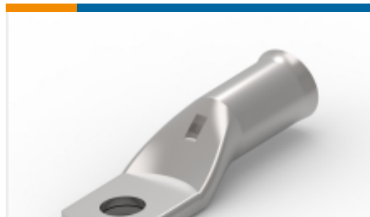
TE 产品编号710030-1 XCT 16-5