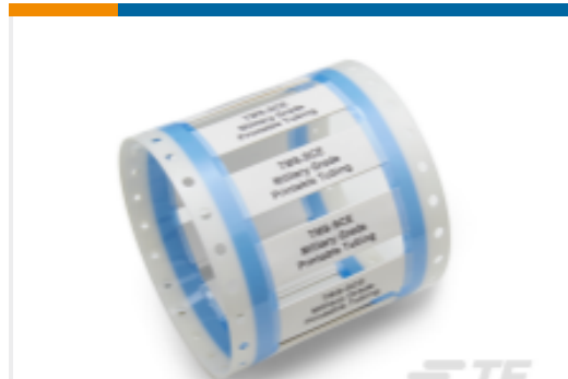
TE 产品编号3212430001 TMS-SCE Military Grade Sleeves