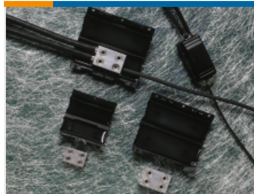
TE 产品编号 446451-000 GTAP-2(B18)