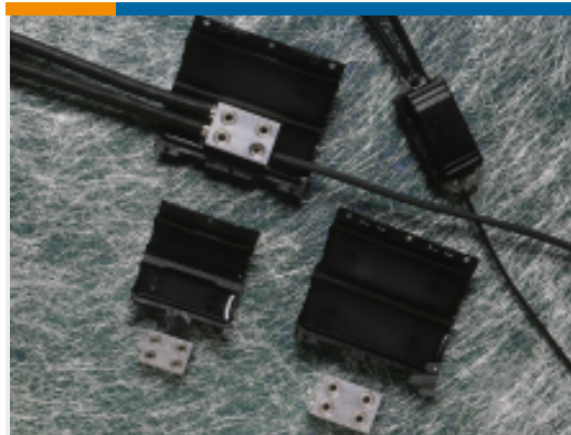
TE 产品编号 566427-000 GTAP-1(B18)