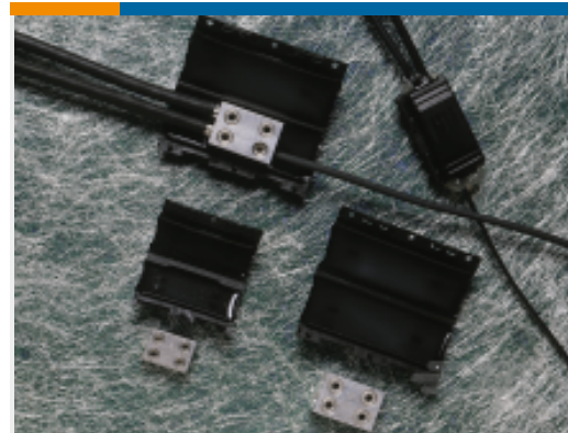
TE 产品编号 981609-000 GTAP-2(B72)