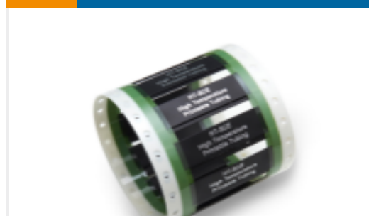
TE 产品编号8947570001 HT-SCE High Temperature Sleeves