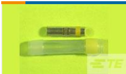
TE 产品编号650127-000 D-436-83