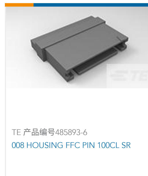
TE 产品编号485893-6 008 HOUSING FFC PIN 100CL SR