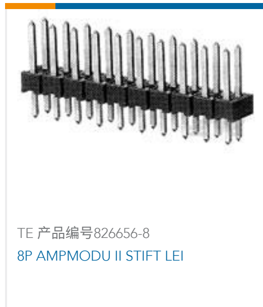
TE 产品编号826656-8 8P AMPMODU II STIFT LEI