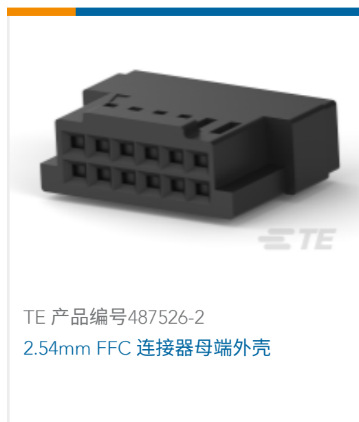
TE 产品编号487526-2 2.54mm FFC 连接器母端外壳