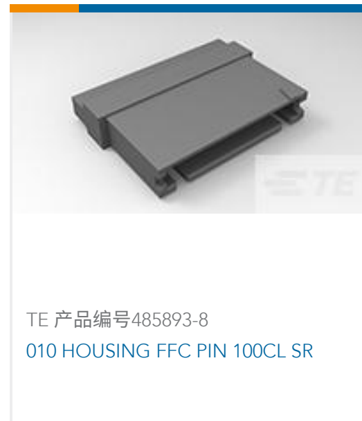
TE 产品编号485893-8 010 HOUSING FFC PIN 100CL SR