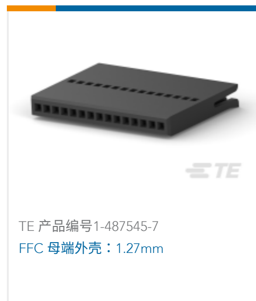
TE 产品编号1-487545-7 FFC 母端外壳：1.27mm