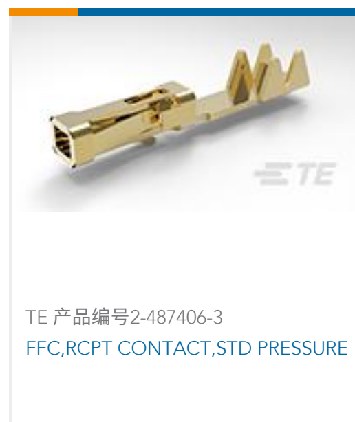
TE 产品编号2-487406-3 FFC,RCPT CONTACT,STD PRESSURE