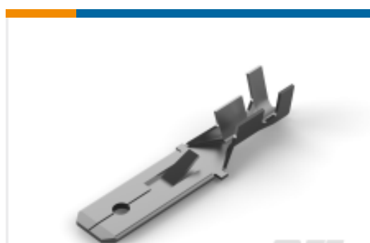
TE 产品编号880636-2 FF 250 TAB 1.0-2.5 MM2 0.39 X 13.2 TPBR