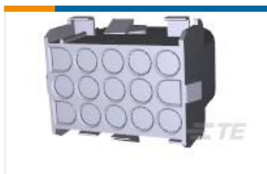
TE 产品编号1-480711-0 15P UMNL CAP HSG NATL