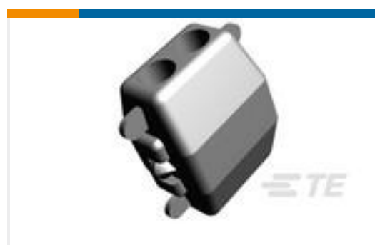
TE 产品编号626437-4 ELCETRO TAP ASSY