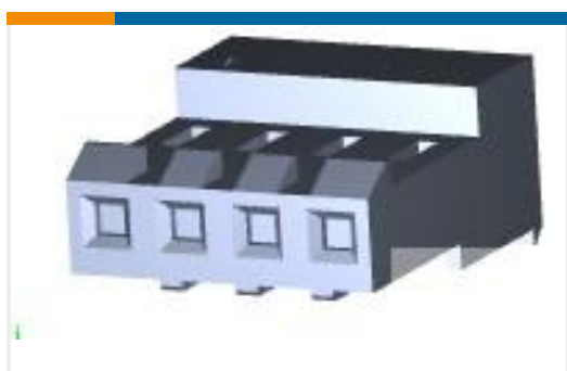
TE 产品编号3-640426-4 04P MTA156 CONN ASSY 18AWG ORA