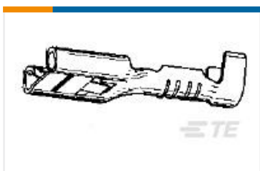
TE 产品编号735222-2 FF 250 REC 1.0-2.5 MM2 0.32X 19.30 BR