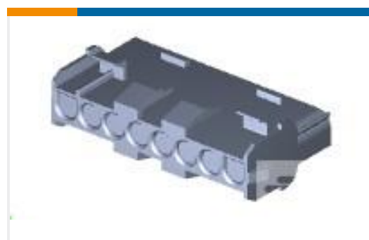
TE 产品编号926308-1 8P UNIV.M-N-L.CAP