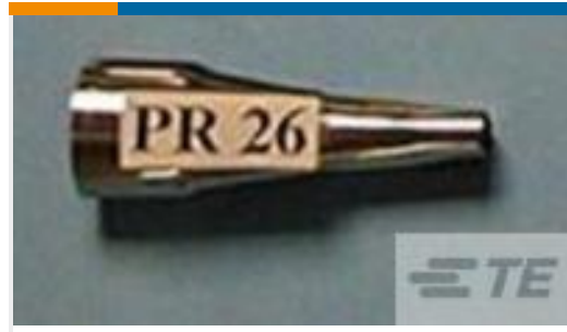
TE 产品编号 991967-000 PR-26-REFLECTOR