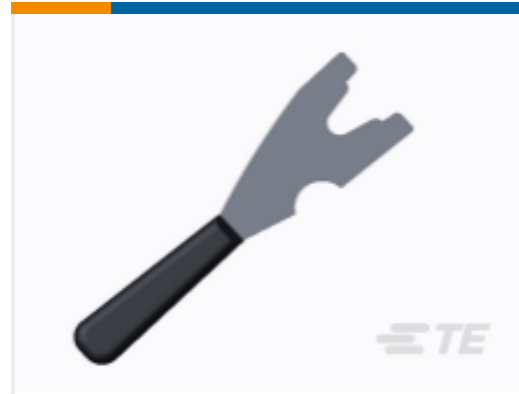
TE 产品编号 121629-000 AD-7-025