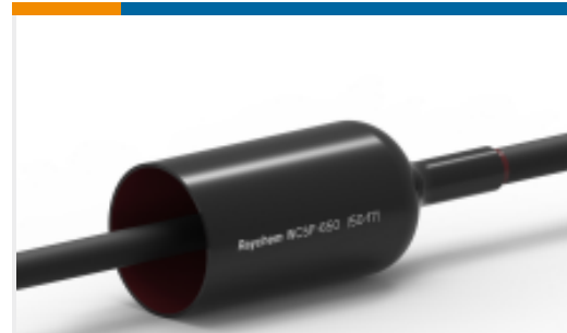
TE 产品编号380728-000 核厚壁热缩管