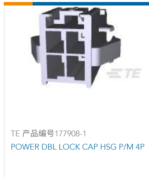
TE 产品编号177908-1 POWER DBL LOCK CAP HSG P/M 4P