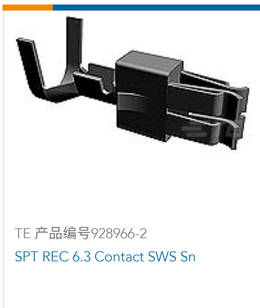
TE 产品编号928966-2 SPT REC 6.3 Contact SWS Sn