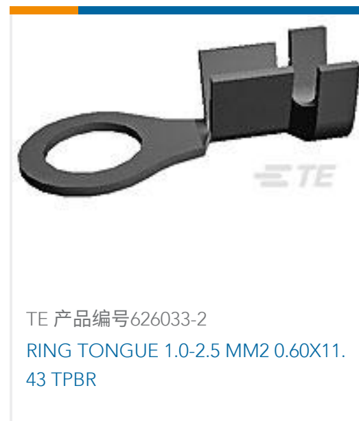
TE 产品编号626033-2 RING TONGUE 1.0-2.5 MM2 0.60X11.43 TPBR