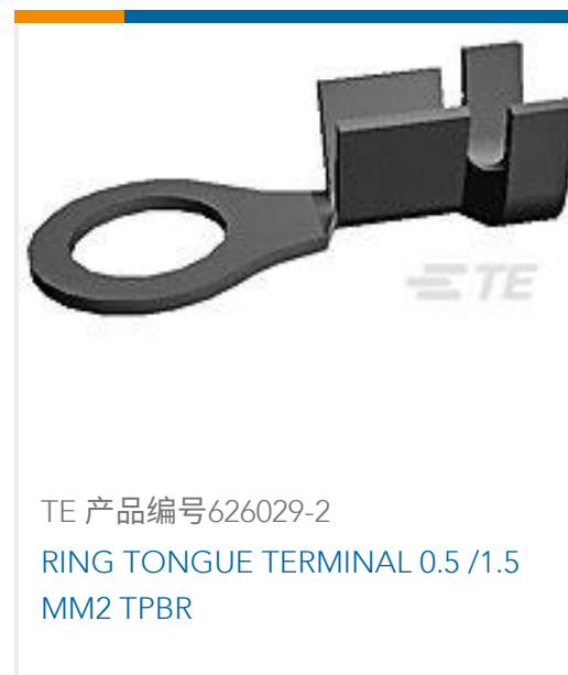
TE 产品编号626029-2 RING TONGUE TERMINAL 0.5 /1.5 MM2 TPBR