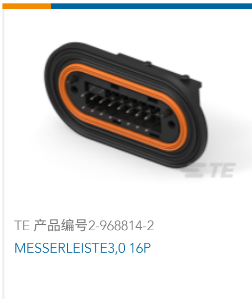
TE 产品编号2-968814-2 MESSERLEISTE3,0 16P