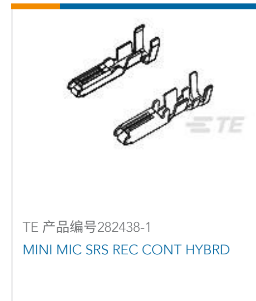
TE 产品编号282438-1 MINI MIC SRS REC CONT HYBRD