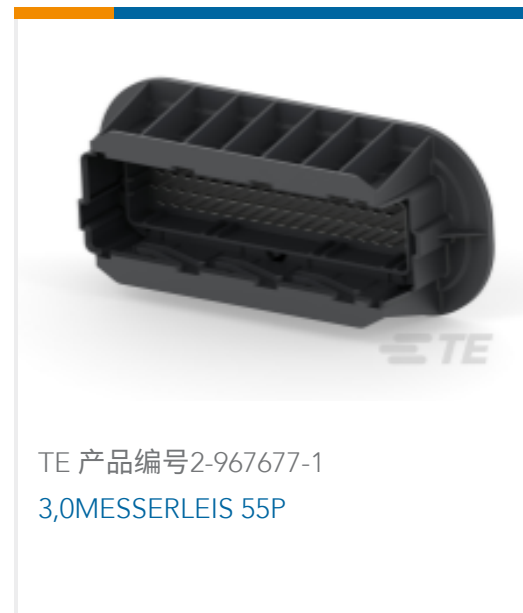
TE 产品编号2-967677-1 3,0MESSERLEIS 55P