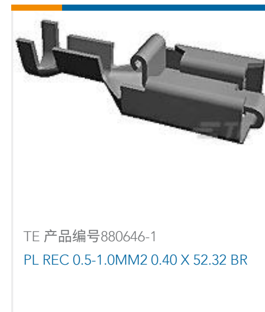
TE 产品编号880646-1 PL REC 0.5-1.0MM2 0.40 X 52.32 BR