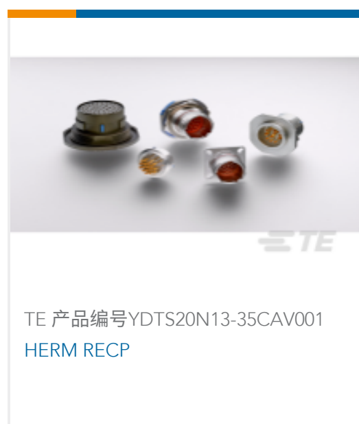
TE 产品编号YDTS20N13-35CAV001 HERM RECP