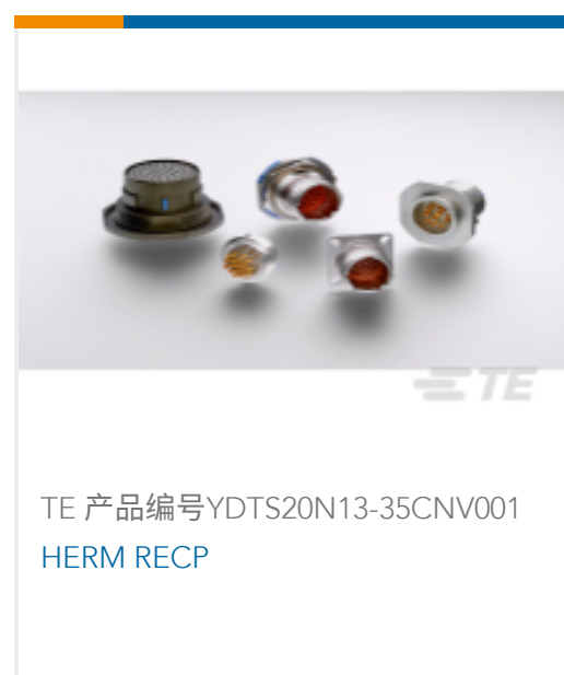
TE 产品编号YDTS20N13-35CNV001 HERM RECP