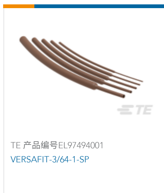
TE 产品编号EL97494001 VERSAFIT-3/64-1-SP