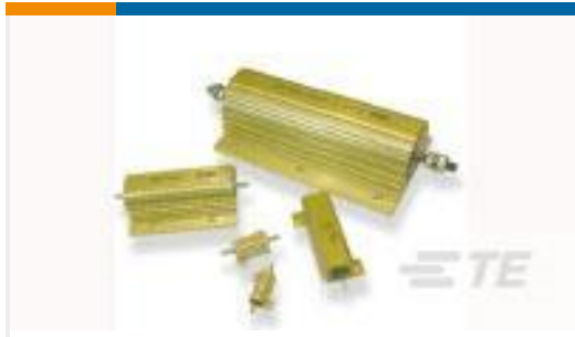
TE 产品编号8-1625971-2 HSA25 R22 5%