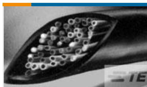
TE 产品编号F24044-000 NT-MIL-3/8-0-SP