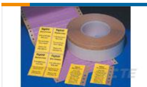
TE 产品编号192868-000 TTVF200WE-100