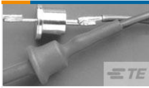
TE 产品编号5677872005 RNF-3000-12/4-9-STK