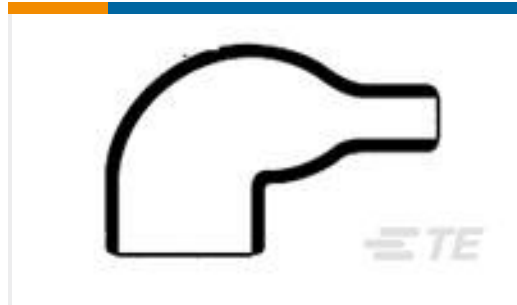
TE 产品编号883099-000 222A111-25-G07-0