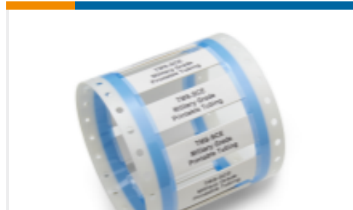
TE 产品编号7992730001 TMS-SCE Military Grade Sleeves