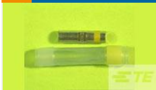
TE 产品编号650127-000 D-436-83