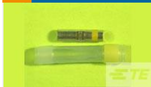
TE 产品编号650126-000 D-436-82