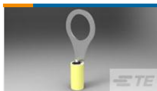
TE 产品编号2-320576-1 TERMINAL,PIDG R 12-10 5/16