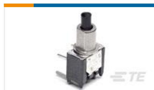
TE 产品编号1825095-3 TP11CGRA004