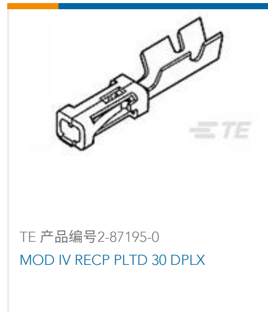
TE 产品编号2-87195-0 MOD IV RECP PLTD 30 DPLX