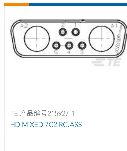
TE 产品编号215927-1 HD MIXED 7C2 RC.ASS