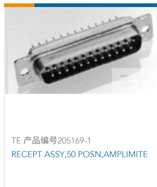
TE 产品编号205169-1 RECEPT ASSY,50 POSN,AMPLIMITE