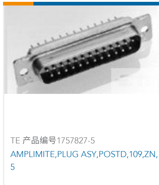
TE 产品编号1757827-5 AMPLIMITE,PLUG ASY,POSTD,109,ZN, 5