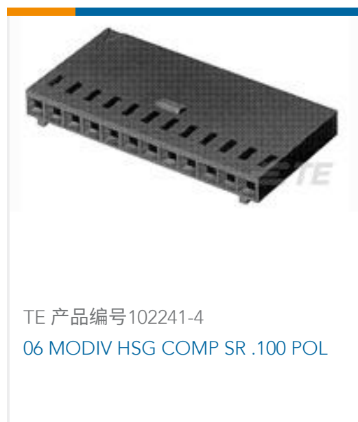
TE 产品编号102241-4 06 MODIV HSG COMP SR .100 POL