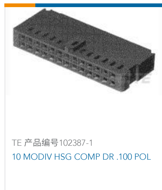
TE 产品编号102387-1 10 MODIV HSG COMP DR .100 POL