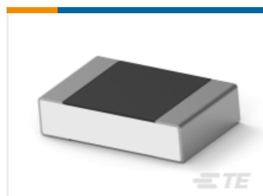
TE 产品编号5-2176378-4 RQ 0805 35R7 0.1% 10PPM 5K RL