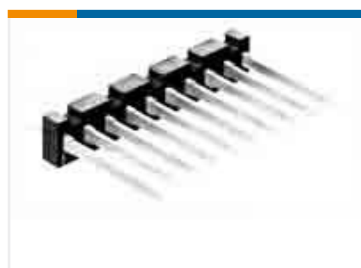
TE 产品编号87633-6 06 MODI HDR SRST .156CL