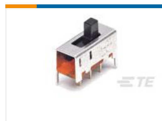
TE 产品编号1825268-1 MSS4300R04=4P3T SL SW R/A AG