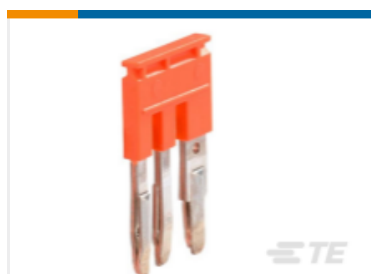
TE 产品编号1SNK900603R0000 JB85-3