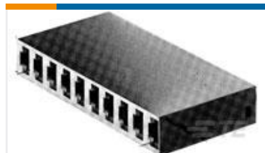
TE 产品编号1-87159-0 10 MODI CRMP S-I HSG SR .156CL