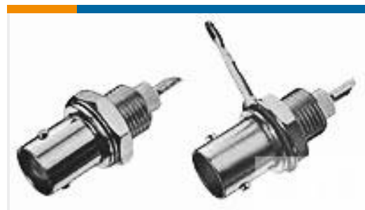
TE 产品编号227715-3 BNC SOLDER RECEPT JACK