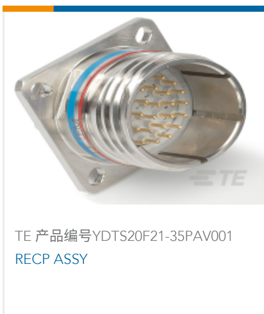
TE 产品编号 YDTS20F21-35PAV001 RECP ASSY