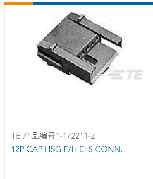
TE 产品编号 1-172211-2 12P CAP HSG F/H EI S CONN.