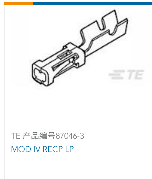
TE 产品编号 87046-3 MOD IV RECP LP