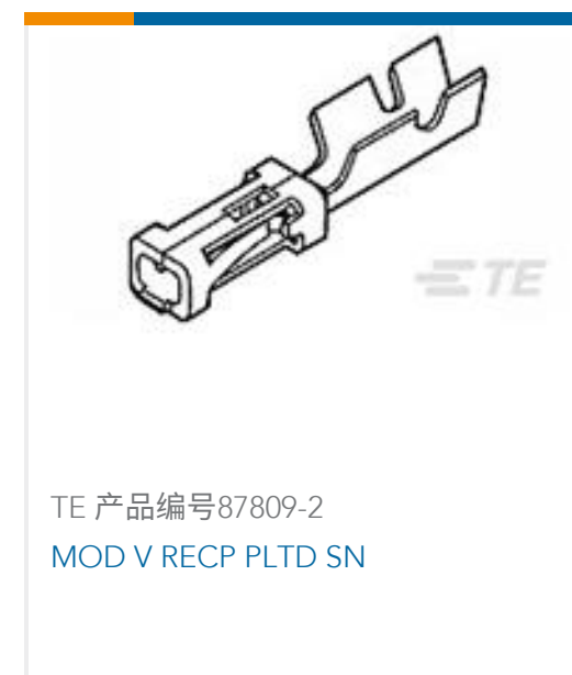
TE 产品编号 87809-2 MOD V RECP PLTD SN