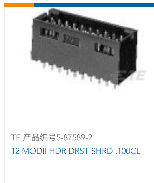
TE 产品编号 5-87589-2 12 MODII HDR DRST SHRD .100CL