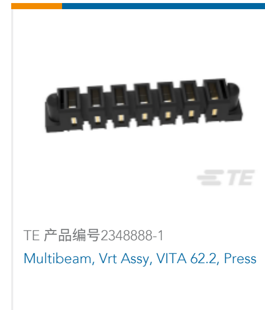
TE 产品编号 2348888-1 Multibeam, Vrt Assy, VITA 62.2, Press