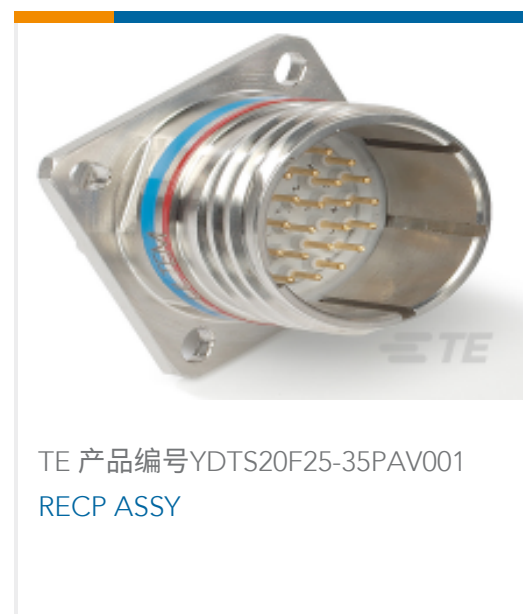
TE 产品编号 YDTS20F25-35PAV001 RECP ASSY