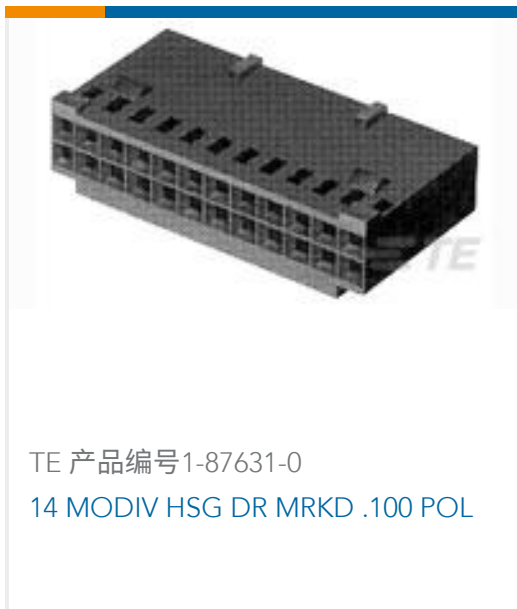
TE 产品编号 1-87631-0 14 MODIV HSG DR MRKD .100 POL