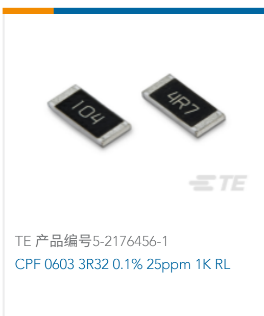
TE 产品编号 5-2176456-1 CPF 0603 3R32 0.1% 25ppm 1K RL