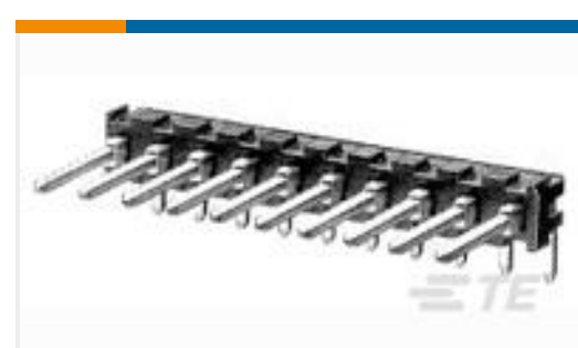
TE 产品编号87233-3 03 MODII HDR SRRA UNSHRD .100