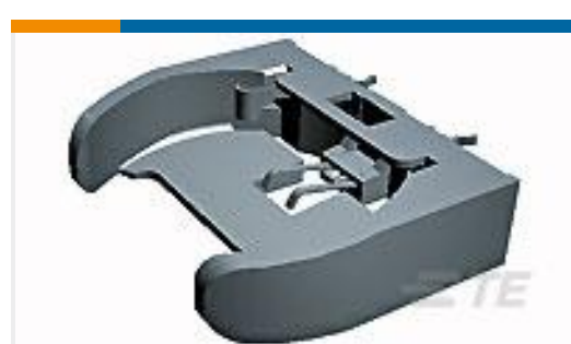
TE 产品编号2-1775485-1 Battery Holder, 3.6mm, BLK, low profile