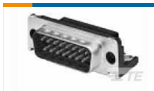
TE 产品编号5747840-2 HD-20 PLUG RA .318 FMS BD-LK