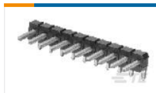
TE 产品编号825437-2 MOD 2 PINHDR 1X02P.