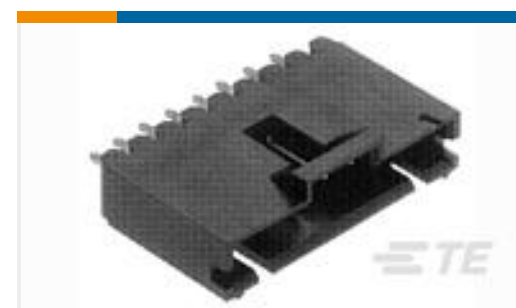
TE 产品编号5-103908-4 05 MTE HDR SRST LATCH W/HLDWN