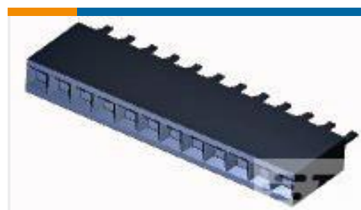
TE 产品编号 5-146386-9 12 MODII VRT SR CE 100/115