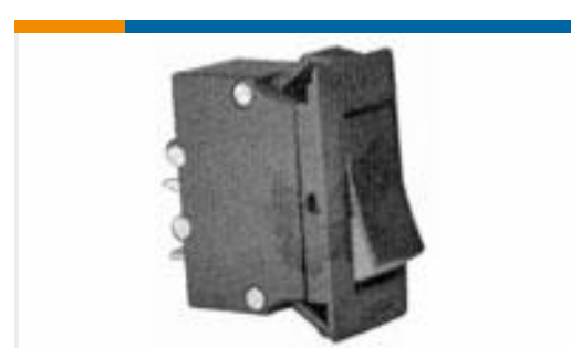
TE 产品编号1423673-6 W51-A121B1-15=CKTBKR,THERM,ROC