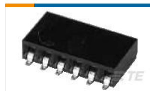
TE 产品编号 147721-3 04 MODII HORZ SR SFMNT 30AU