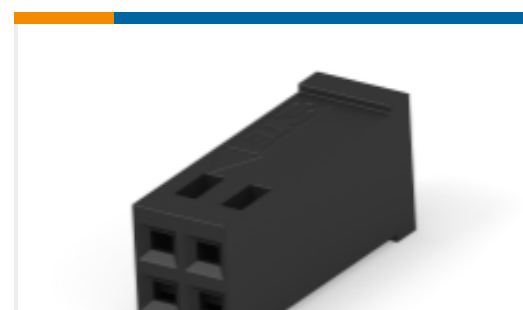
TE 产品编号 4-87456-9 04 MODIV HSG COMP DR .100CL