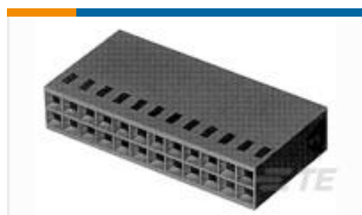
TE 产品编号 5-87456-0 04 MODIV HSG DR MRKD .100CL