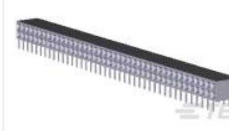
TE 产品编号 4-5146140-0 82 MODII HORZ DR CE 100CL