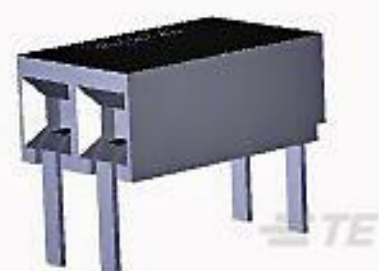
TE 产品编号 5535676-1 02 MODII HORZ SR CE 100CL