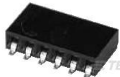
TE 产品编号 147721-1 02 MODII HORZ SR SFMNT 30AU