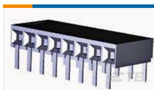
TE 产品编号 5535676-7 08 MODII HORZ SR CE 100CL