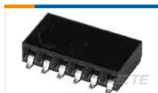
TE 产品编号 147721-7 08 MODII HORZ SR SFMNT 30AU