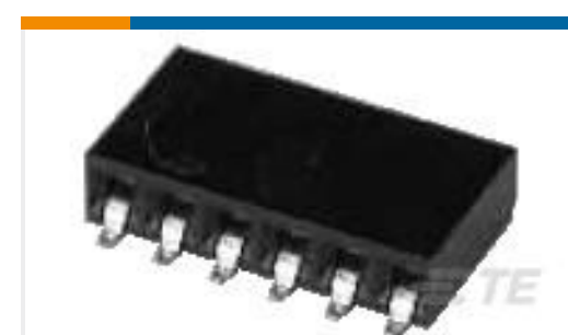
TE 产品编号 4-147721-7 48 MODII HORZ SR SFMNT 30AU