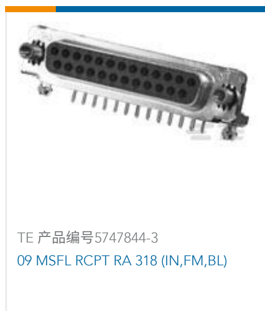
TE 产品编号 5747844-3 09 MSFL RCPT RA 318 (IN,FM,BL)