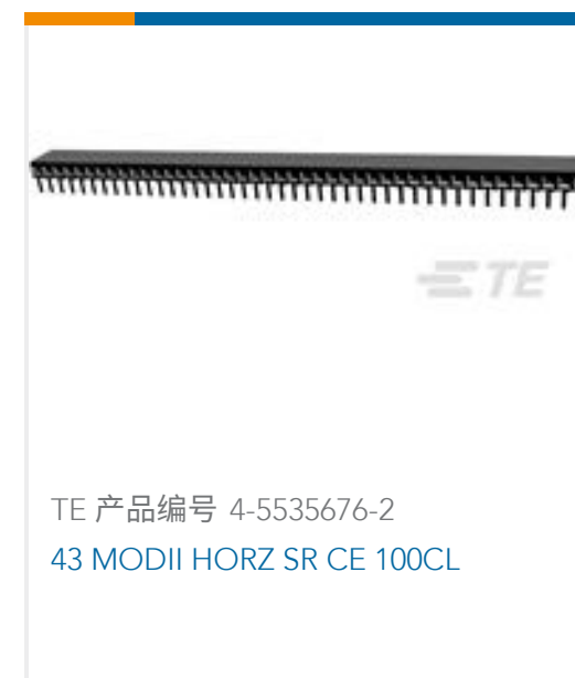
TE 产品编号 4-5535676-2 43 MODII HORZ SR CE 100CL