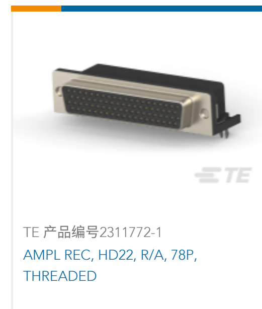
TE 产品编号2311772-1 AMPL REC, HD22, R/A, 78P, THREADED