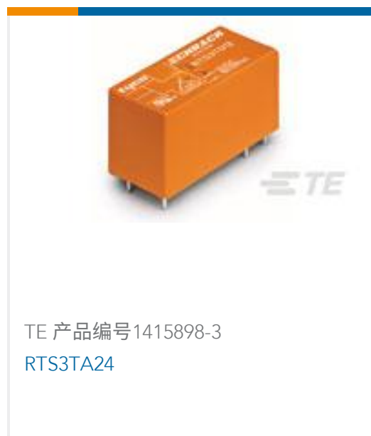
TE 产品编号1415898-3 RTS3TA24