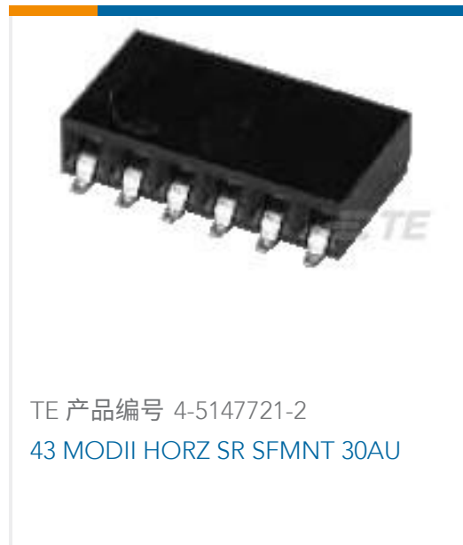
TE 产品编号 4-5147721-2 43 MODII HORZ SR SFMNT 30AU