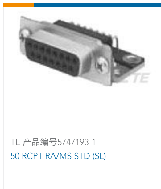
TE 产品编号5747193-1 50 RCPT RA/MS STD (SL)