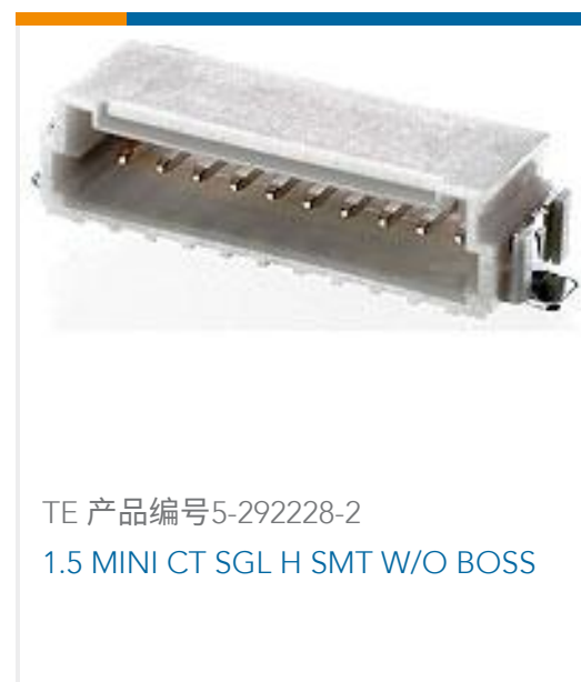
TE 产品编号5-292228-2 1.5 MINI CT SGL H SMT W/O BOSS