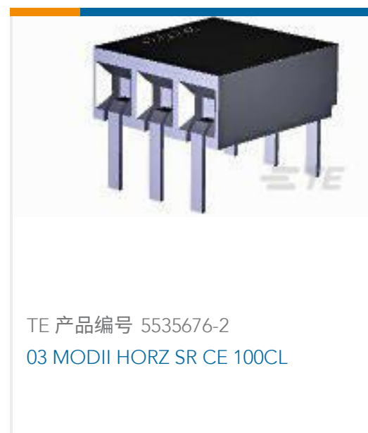
TE 产品编号 5535676-2 03 MODII HORZ SR CE 100CL