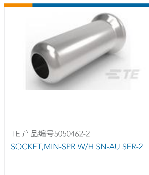
TE 产品编号 5050462-2 SOCKET,MIN-SPR W/H SN-AU SER-2