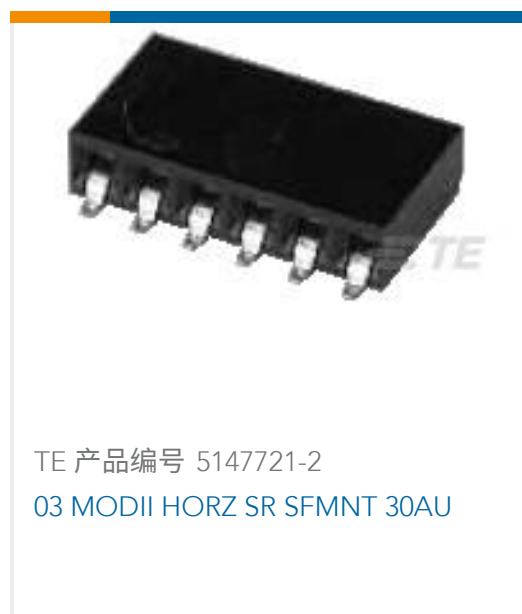
TE 产品编号 5147721-2 03 MODII HORZ SR SFMNT 30AU