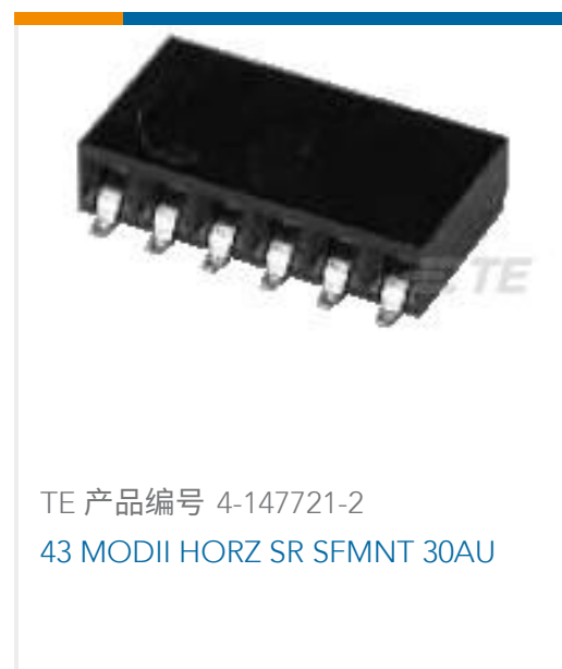
TE 产品编号 4-147721-2 43 MODII HORZ SR SFMNT 30AU