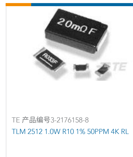
TE 产品编号 3-2176158-8 TLM 2512 1.0W R10 1% 50PPM 4K RL