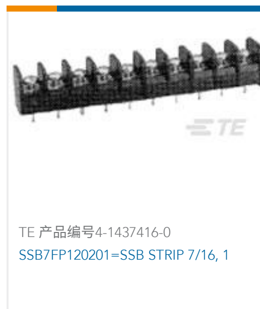
TE 产品编号4-1437416-0 SSB7FP120201=SSB STRIP 7/16, 1