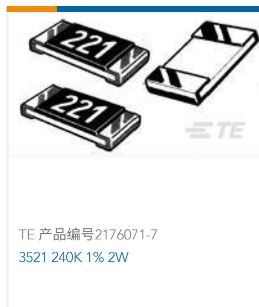
TE 产品编号 2176071-7 3521 240K 1% 2W