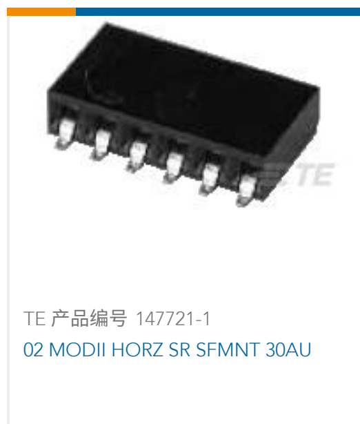
TE 产品编号 147721-1 02 MODII HORZ SR SFMNT 30AU