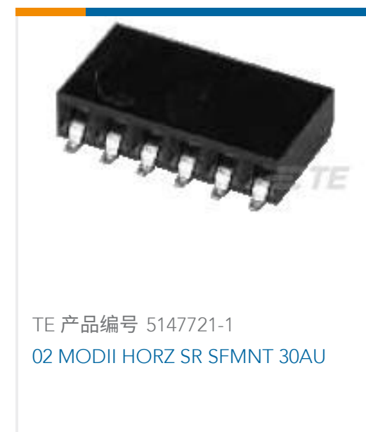
TE 产品编号 5147721-1 02 MODII HORZ SR SFMNT 30AU