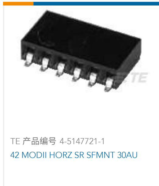
TE 产品编号 4-5147721-1 42 MODII HORZ SR SFMNT 30AU