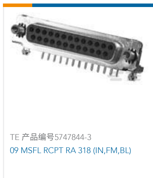
TE 产品编号5747844-3 09 MSFL RCPT RA 318 (IN,FM,BL)