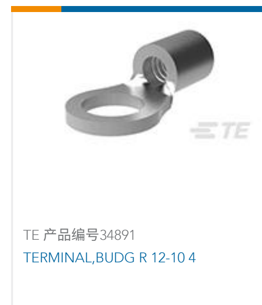
TE 产品编号34891 TERMINAL,BUDG R 12-10 4