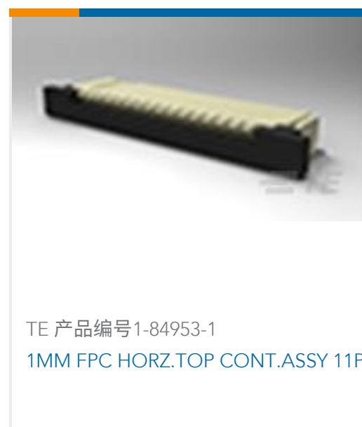
TE 产品编号1-84953-1 1MM FPC HORZ.TOP CONT.ASSY 11P