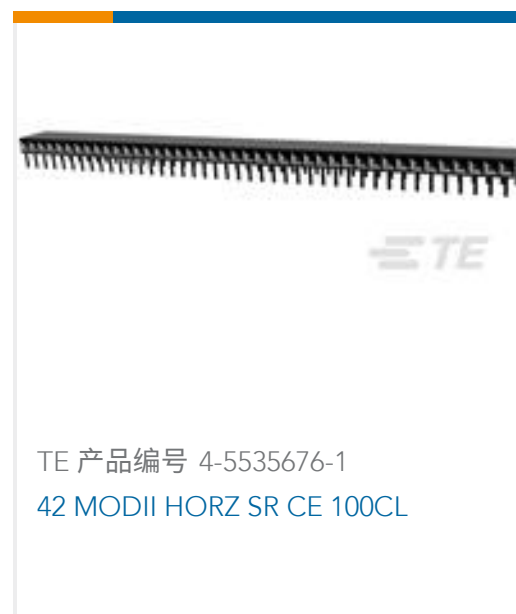
TE 产品编号 4-5535676-1 42 MODII HORZ SR CE 100CL