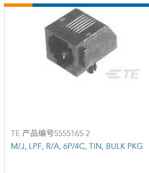
TE 产品编号5555165-2 M/J, LPF, R/A, 6P/4C, TIN, BULK PKG