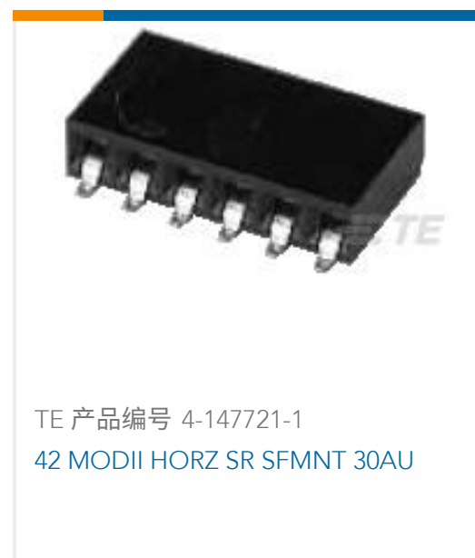
TE 产品编号 4-147721-1 42 MODII HORZ SR SFMNT 30AU