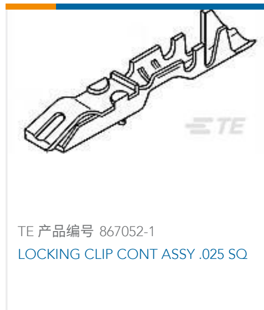
TE 产品编号 867052-1 LOCKING CLIP CONT ASSY .025 SQ