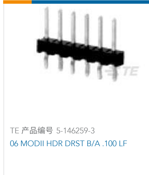
TE 产品编号 5-146259-3 06 MODII HDR DRST B/A .100 LF