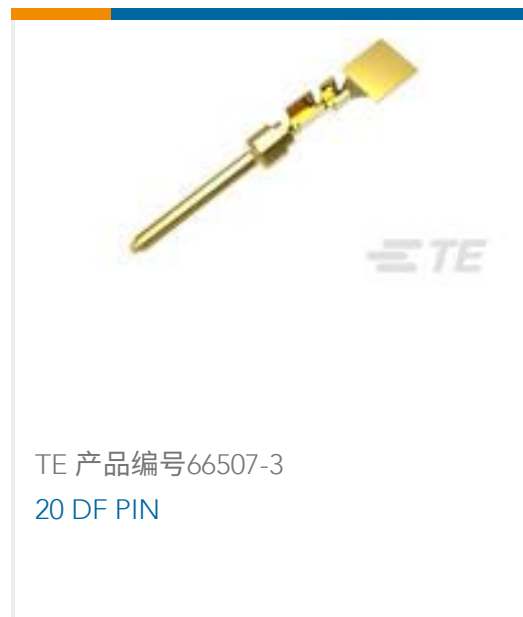
TE 产品编号66507-3 20 DF PIN