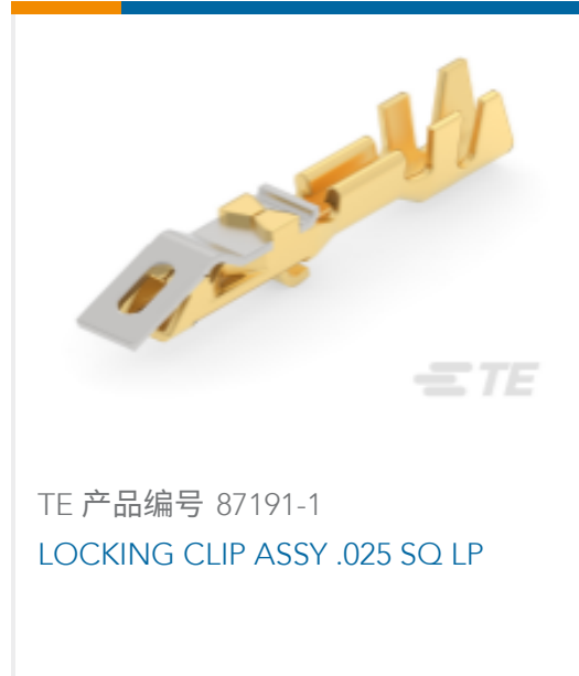
TE 产品编号 87191-1 LOCKING CLIP ASSY .025 SQ LP