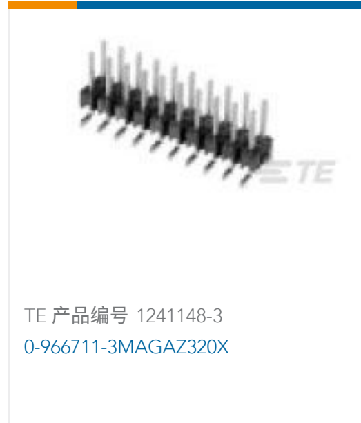
TE 产品编号 1241148-3 0-966711-3MAGAZ320X