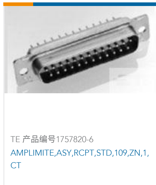
TE 产品编号1757820-6 AMPLIMITE,ASY,RCPT,STD,109,ZN,1,CT