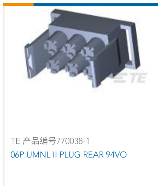
TE 产品编号770038-1 06P UMNL II PLUG REAR 94VO