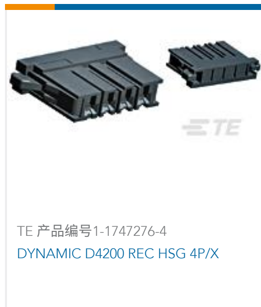
TE 产品编号1-1747276-4 DYNAMIC D4200 REC HSG 4P/X