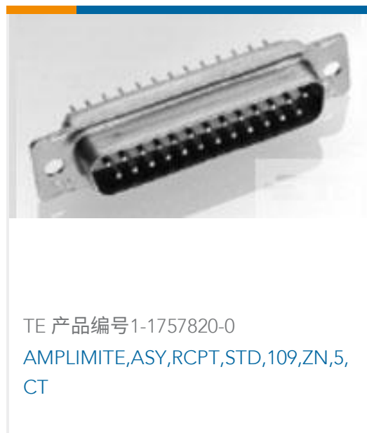
TE 产品编号1-1757820-0 AMPLIMITE,ASY,RCPT,STD,109,ZN,5,CT