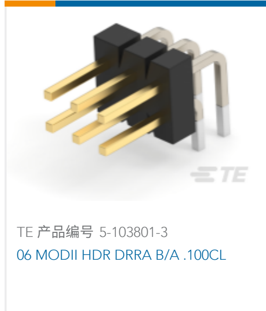
TE 产品编号 5-103801-3 06 MODII HDR DRRA B/A .100CL