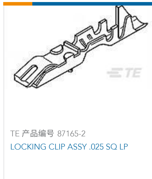
TE 产品编号 87165-2 LOCKING CLIP ASSY .025 SQ LP