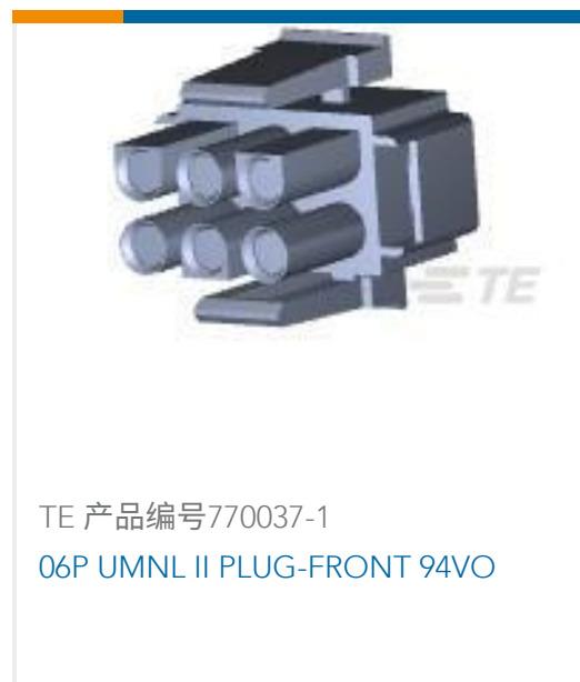
TE 产品编号770037-1 06P UMNL II PLUG-FRONT 94VO