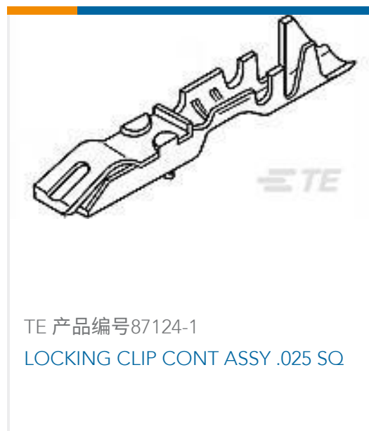
TE 产品编号87124-1 LOCKING CLIP CONT ASSY .025 SQ