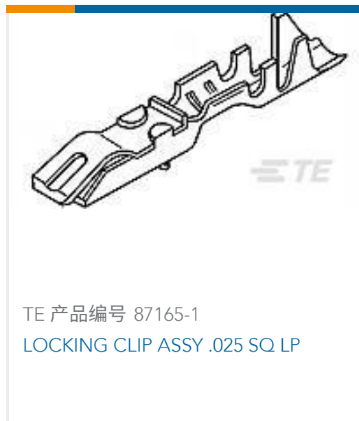
TE 产品编号 87165-1 LOCKING CLIP ASSY .025 SQ LP