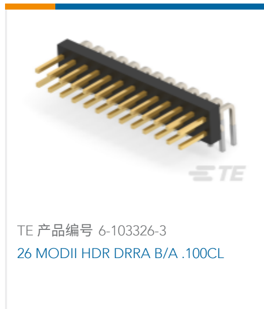
TE 产品编号 6-103326-3 26 MODII HDR DRRA B/A .100CL