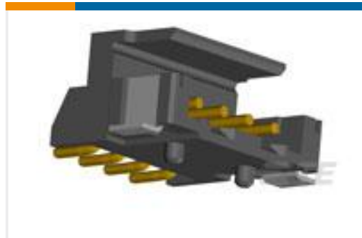
TE 产品编号2-292173-2 CT BOX HDR H SMT 2P O/TAPE BLA