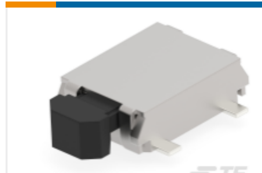
TE 产品编号1571262-4 SWITCH,TACTILE,SMT,W/BOSS,T&R