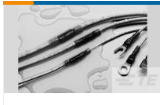
TE 产品编号967398-000 D-406-0001