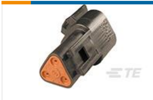
TE 产品编号DT04-3P-CE02 REC, 3P, BLK, E