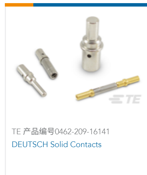
TE 产品编号0462-209-16141 DEUTSCH Solid Contacts