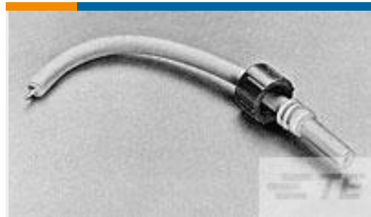
TE 产品编号4-837655-5 LEAD, SGL END ASSY, LGH