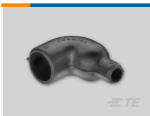
TE 产品编号806823-000 球形热缩护套：有嘴，直角