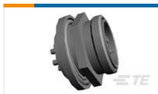
TE 产品编号862004-1 RECEPTACLE