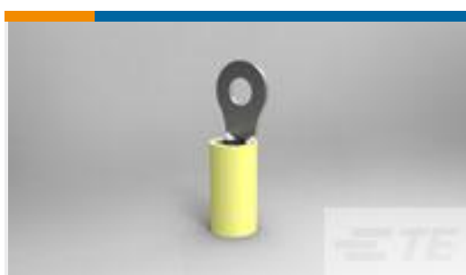
TE 产品编号35108 TERMINAL,PIDG R 12-10 8