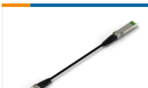
TE 产品编号2821222-3 SFP28 DIRECT ATTACH CA, 1M, 30AWG