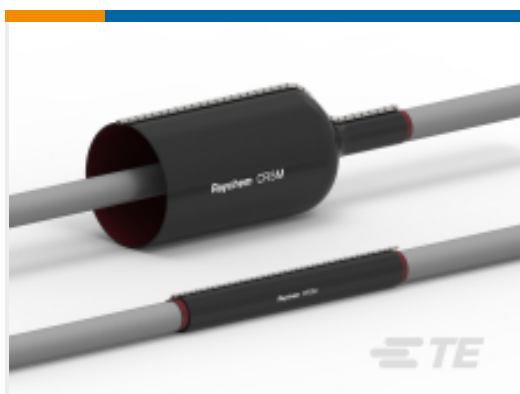
TE 产品编号364197-000 Wraparound Cable Tap Splices