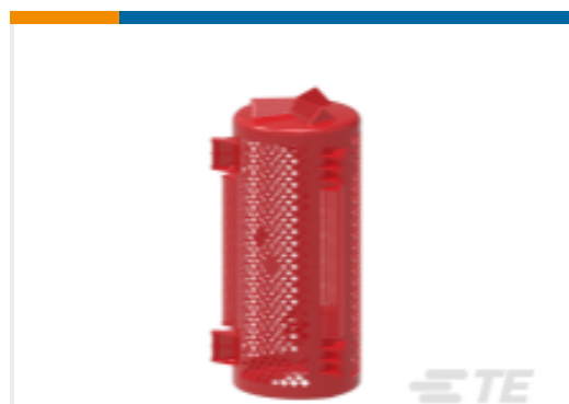
TE 产品编号CS7744-000 BCAC-IC-7D/12(B6)