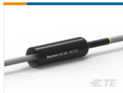
TE 产品编号CU7129-000 厚壁热缩管