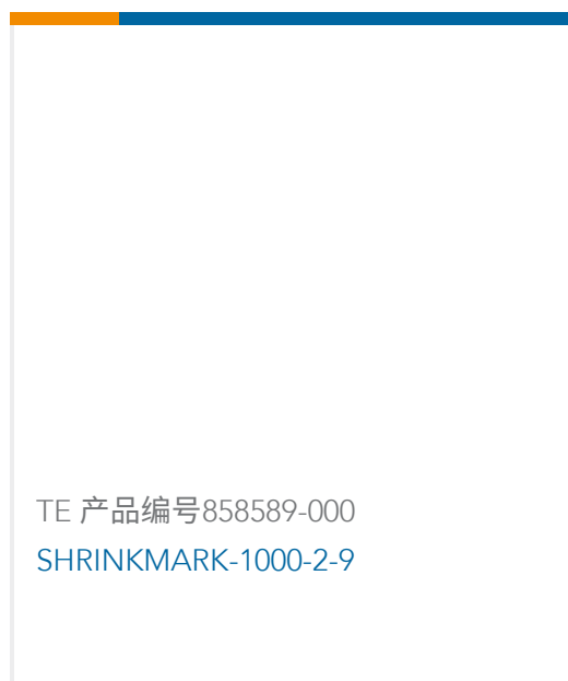
TE 产品编号858589-000 SHRINKMARK-1000-2-9