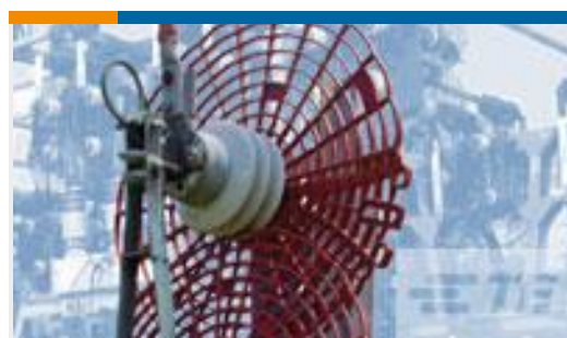
TE 产品编号CR8835-000 BISG-24-01(B10)