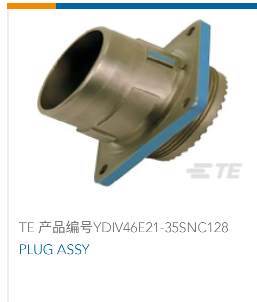
TE 产品编号YDIV46E21-35SNC128 PLUG ASSY