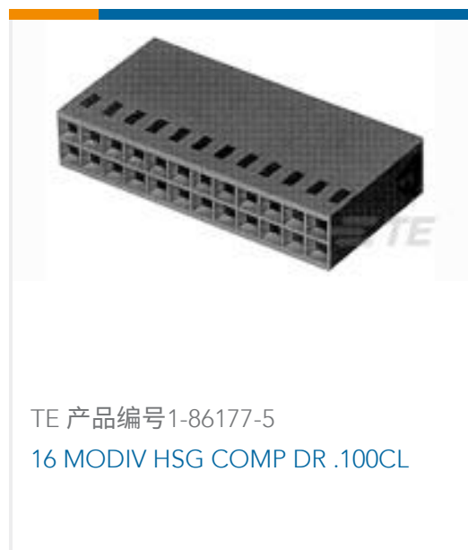
TE 产品编号1-86177-5 16 MODIV HSG COMP DR .100CL