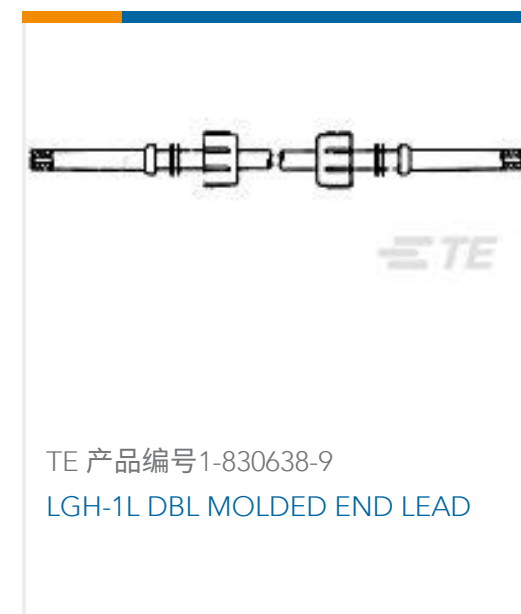
TE 产品编号1-830638-9 LGH-1L DBL MOLDED END LEAD