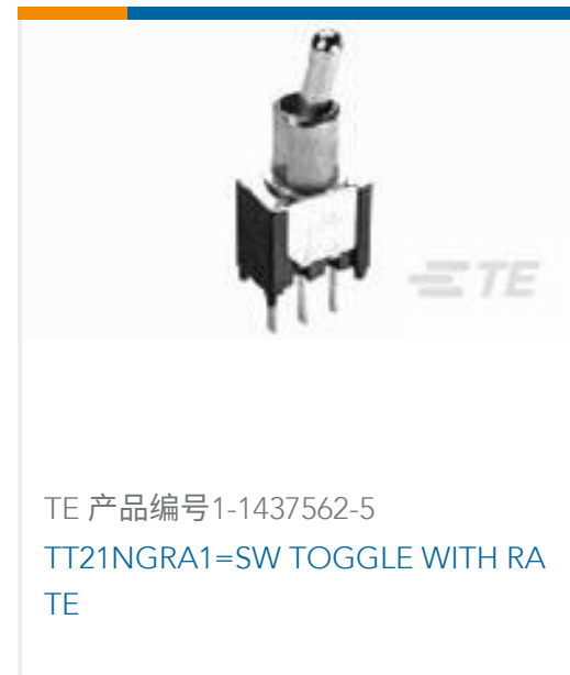
TE 产品编号1-1437562-5 TT21NGRA1=SW TOGGLE WITH RA TE