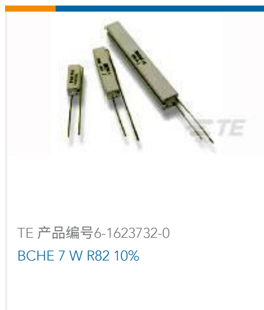
TE 产品编号6-1623732-0 BCHE 7 W R82 10%