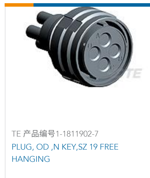
TE 产品编号1-1811902-7 PLUG, OD, N KEY, SZ 19 FREE HANGING