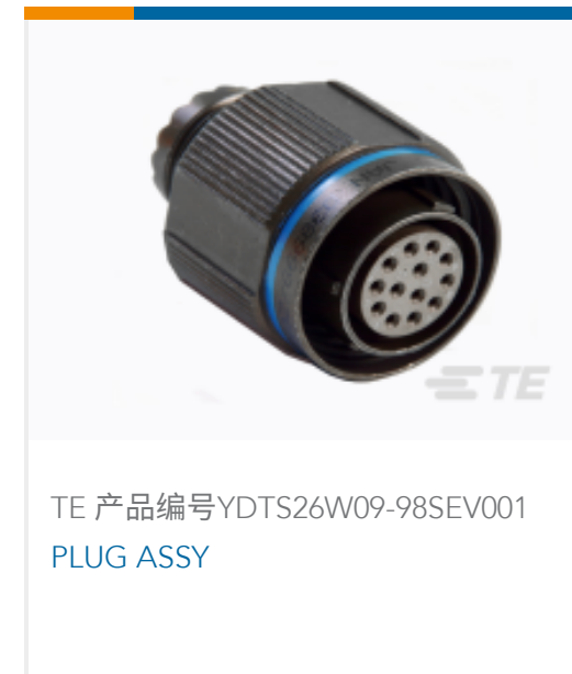
TE 产品编号YDTS26W09-98SEV001 PLUG ASSY