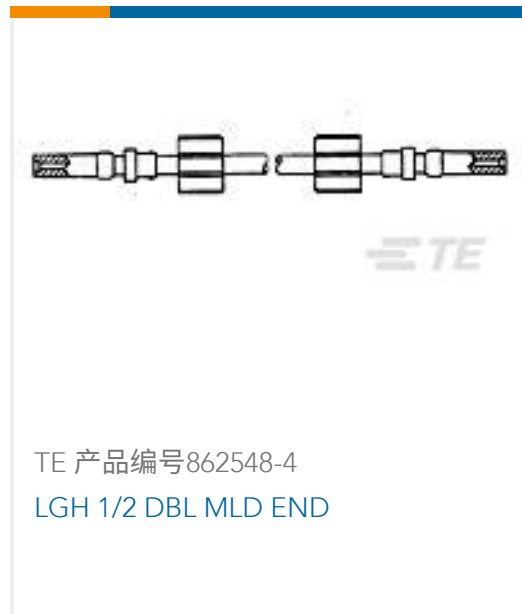
TE 产品编号862548-4 LGH 1/2 DBL MLD END