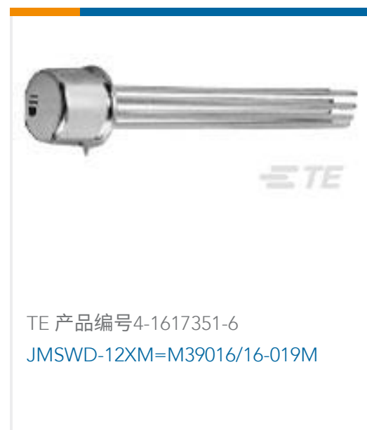
TE 产品编号4-1617351-6 JMSWD-12XM=M39016/16-019M