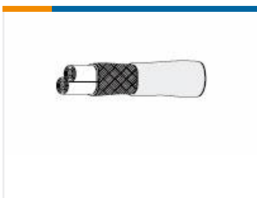
TE 产品编号5426653001 55A1121-20-2/5-2