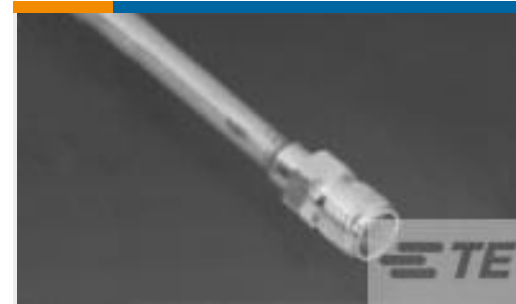
TE 产品编号1050859-1 2002 5016 00