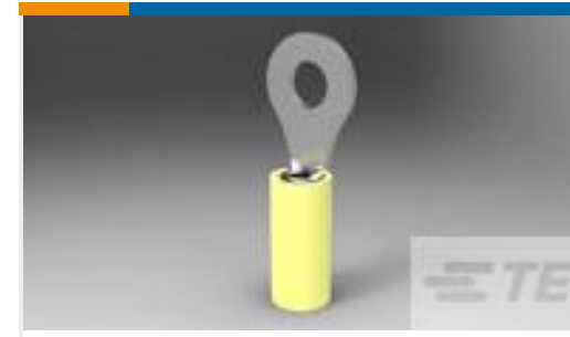
TE 产品编号53073 TERMINAL,PIDG R 26-24 6