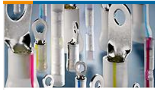
TE 产品编号53406-1 PIDG PVF2 R 22-16COM22-18MIL 6