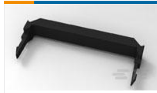
TE 产品编号499252-1 040 STRAIN RELIEF A-L RCPT