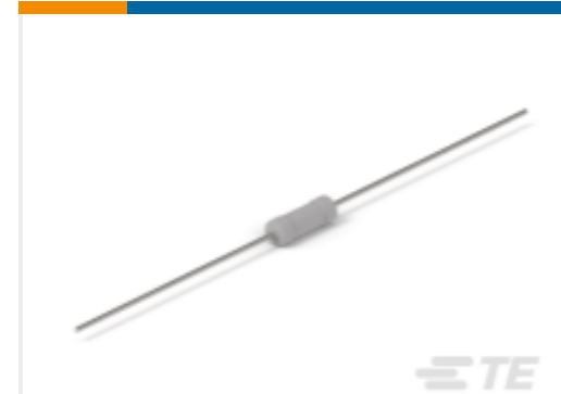
TE 产品编号9-1676123-3 1/2W SM M/OX 5% 5K6