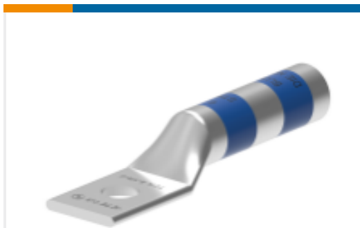
TE 产品编号EN3750-662 TCTL-2-5/16-U