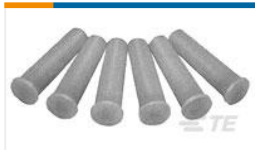
TE 产品编号69338-1 CARTRIDGE ASSY, AMPACT BLUE