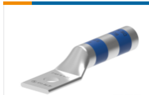
TE 产品编号EN3750-461 TCTL-350-1/2-U