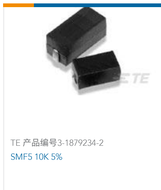
TE 产品编号3-1879234-2 SMF5 10K 5%