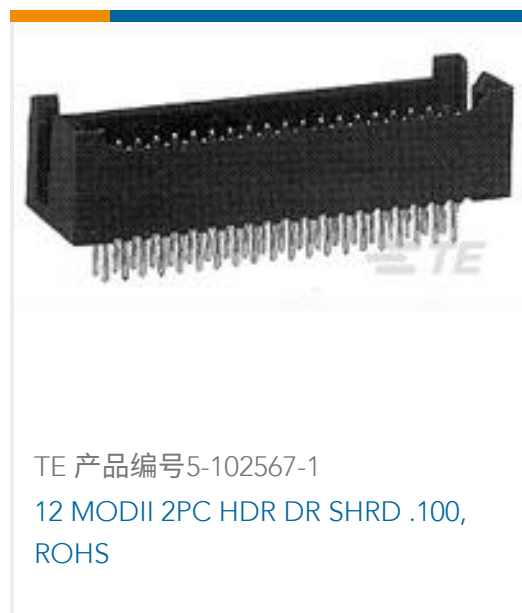
TE 产品编号5-102567-1 12 MODII 2PC HDR DR SHRD .100, ROHS