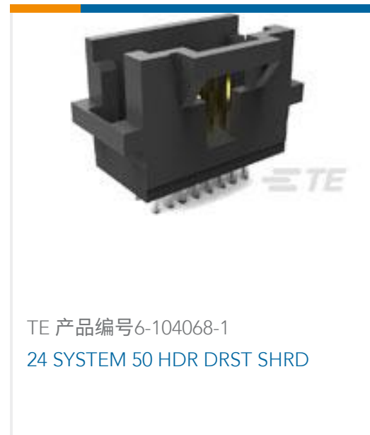
TE 产品编号6-104068-1 24 SYSTEM 50 HDR DRST SHRD