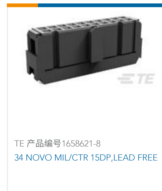
TE 产品编号1658621-8 34 NOVO MIL/CTR 15DP, LEAD FREE