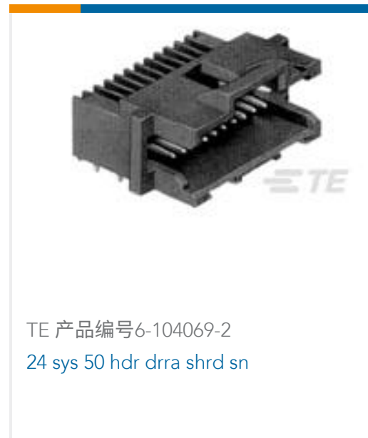
TE 产品编号6-104069-2 24 sys 50 hdr drra shrd sn