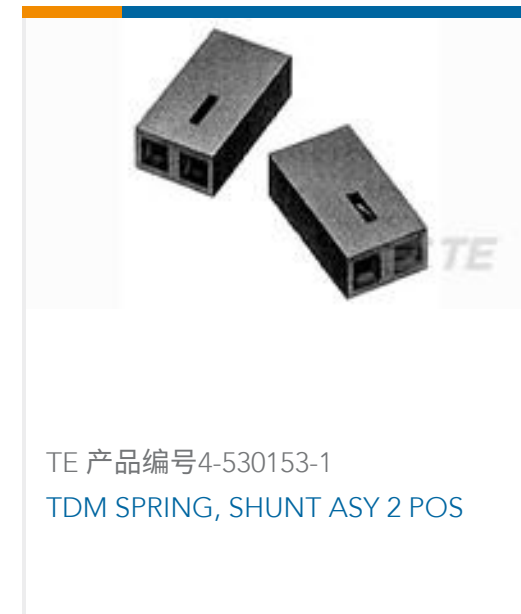
TE 产品编号4-530153-1 TDM SPRING, SHUNT ASY 2 POS