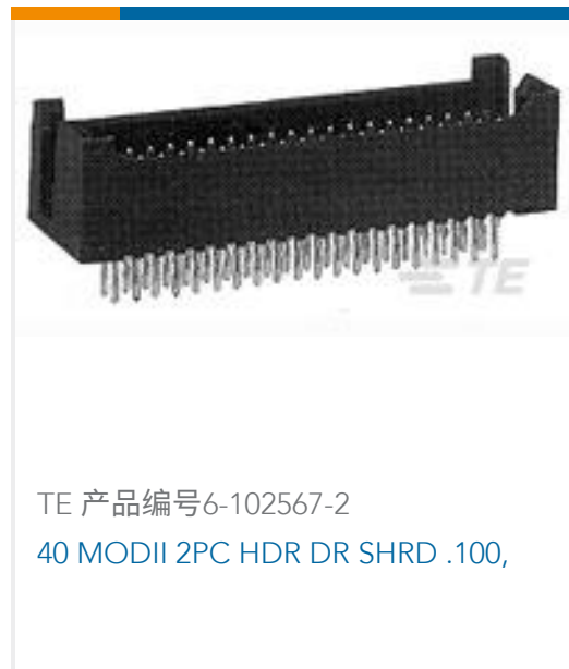
TE 产品编号6-102567-2 40 MODII 2PC HDR DR SHRD .100,